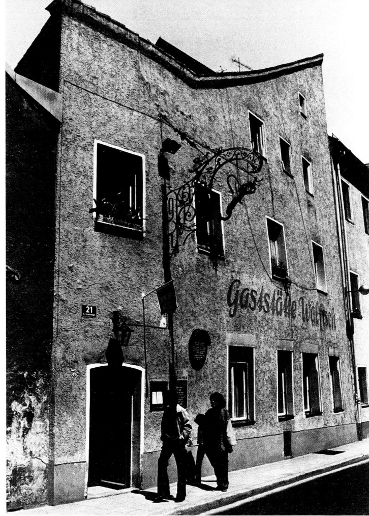
Die Gastwirtschaft „Zum Walfisch“, Unter den Schwibbögen 21

Die folgenden Ereignisse des 15. November 1686, die auf uns Heutige wie ein theatrales happening wirken, kamen also nicht ganz unmotiviert, wie ein Blitz aus heiterem Himmel. Offenbar hatte sich in Regensburg bereits einiger Unmut über die losen Sitten des Engländers angestaut, und einige waren der Meinung, das Maß sei voll.