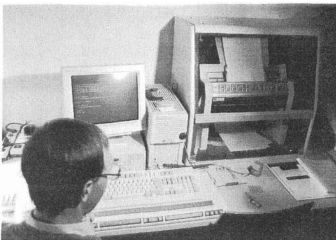
Ob selbst eingegeben oder vom Scanner erfaßt, alle Texte können bearbeitet, akustisch wiedergegeben und in Braille- oder Normalschrift ausgedruckt werden.