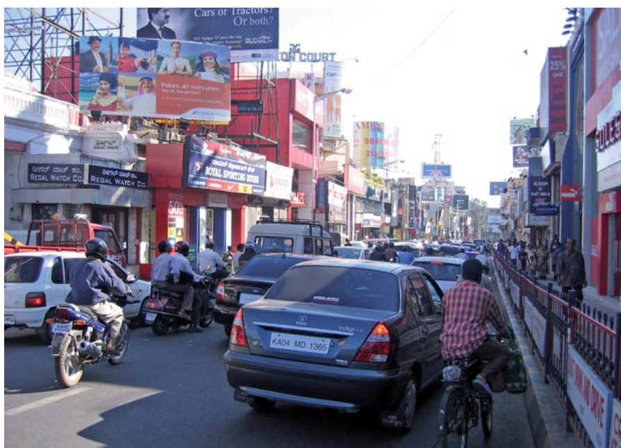
Bangalore – High Tech und überfüllte Straßen

tung ihrer Ergebnisse ging, 30 % der Wissenschaftler glaubten, mit OA eine breitere Rezipientenbasis zu erreichen als mit traditionellem Publikationsverhalten. Nahezu alle Wissenschaftler aber (und dies steht im Gegensatz zu den Publikationen von Harnard und Eisenbach, die behaupten, dass Open Access eine höhere Wahrnehmung erzielt als traditionelle Publikationen) sind der Meinung, dass die traditionellen Veröffentlichungen eine höhere Wahrnehmung erzielen als eine Open Access-Publikation.