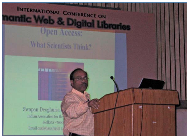
Open Access ist überall ein Thema