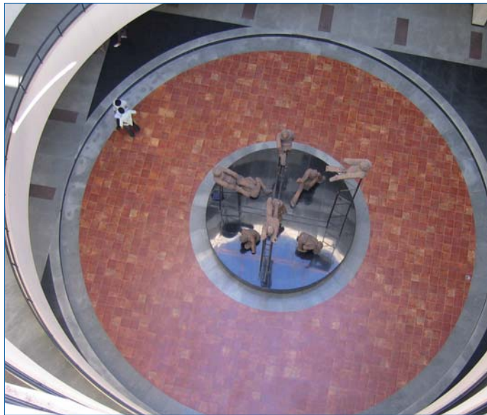
Blick in das Gästehaus des Indian Institute of Bangalore