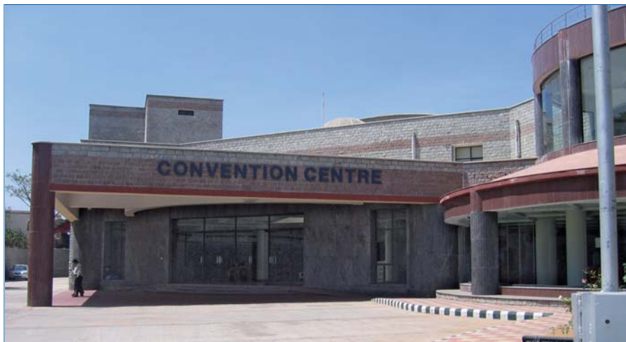
Der Veranstaltungsort der ICSD: Das Convention Center in Bangalore

Auch das dritte Gesetz „Every book it's reader“ hat in Zeiten der digitalen Informationsschwemme größte Aktualität. Es darf und muss heute durchaus gefragt werden, ob der immense Inhalt, der elektronisch