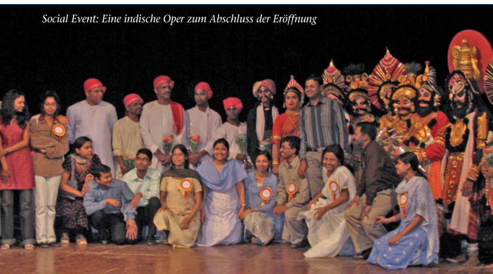
Social Event: Eine indische Oper zum Abschluss der Eröffnung

Im Resümee ziehen die beiden Autoren den Schluss, dass Bibliotheken de facto digitale Verleger geworden und gleichzeitig einige Verleger zu Informationsanbietern wie Google, Yahoo oder Open Content Alliance geworden seien.