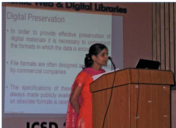
Digital Preservation: Ein zentrales Thema auf der ICSD in Bangalore