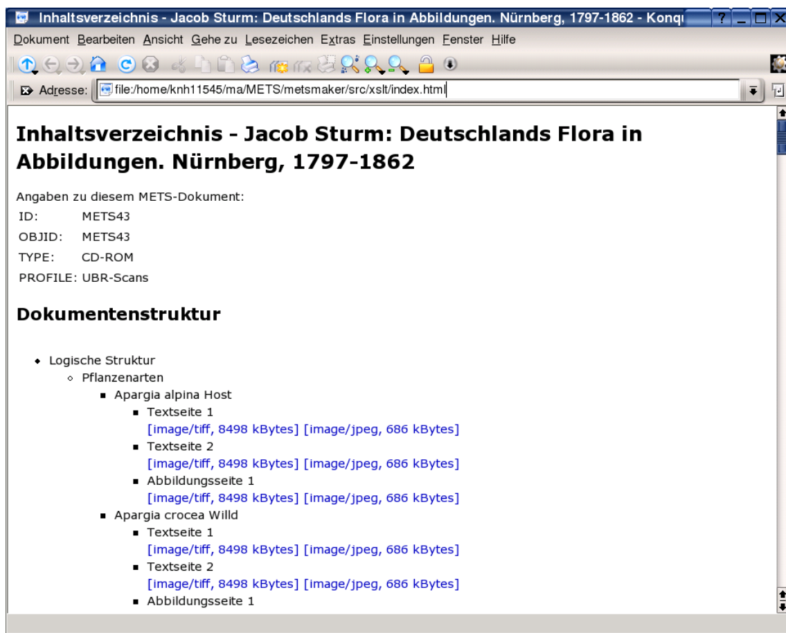
Abb. 4.1: Ansicht einer aus einem METS-Dokumente generierten HTML-Datei im Webbrowser: Seitenkopf mit Angaben zum METS-Dokument (Meta-Metadaten) und erster Teil der Dokumentenstruktur.