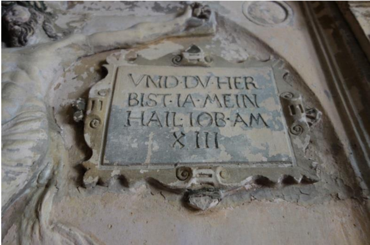
Abb. 8: Obere rechte Inschrift (je nach Betrachtungsweise tritt hier der Kippfigur-Effekt auf: Wechsel von Tief- und Hochrelief).