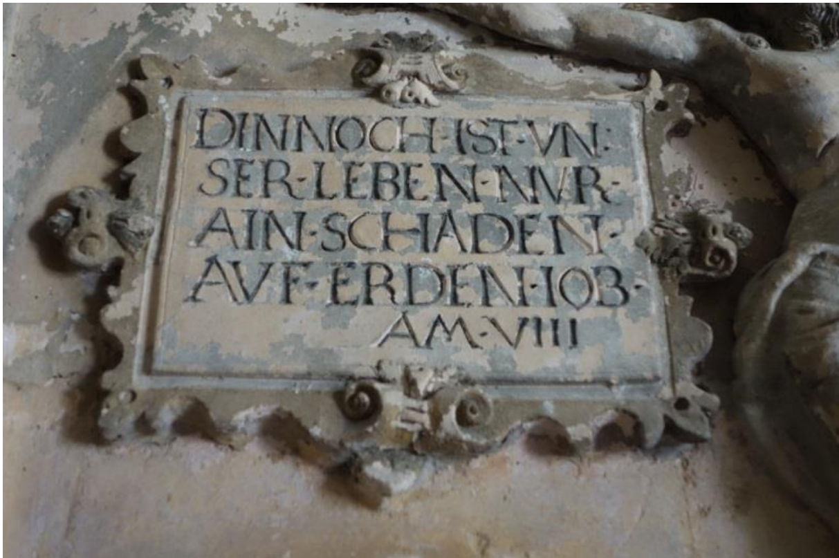
Abb. 7: Obere linke Inschrift.