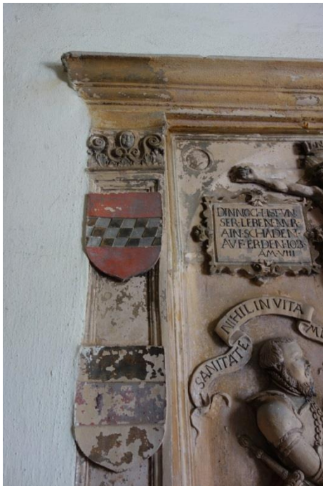
Abb. 3: Linker Pilaster mit aufgeklebtem Wappenschild und nichtklassischem Kapitell.

Corpus Christi (s. Abb. 5). Das Bildprogramm selbst ist konventionell: der betende Ritter unter dem Kruzifix mit Wahlspruch und zwei Wappenschilden unter drei Helmzierden. Dieses Programm findet sich sowohl in der Spätgotik als auch im Barock; Die Figuren sind - zwangsläufig - asymmetrisch angeordnet; zusammen gesehen gruppieren sich jedoch die Bildprogrammteile (Ritter mit heraldischem Apparat, die beiden oberen Inschriften) symmetrisch um die vertikale Achse des Kruzifixus.