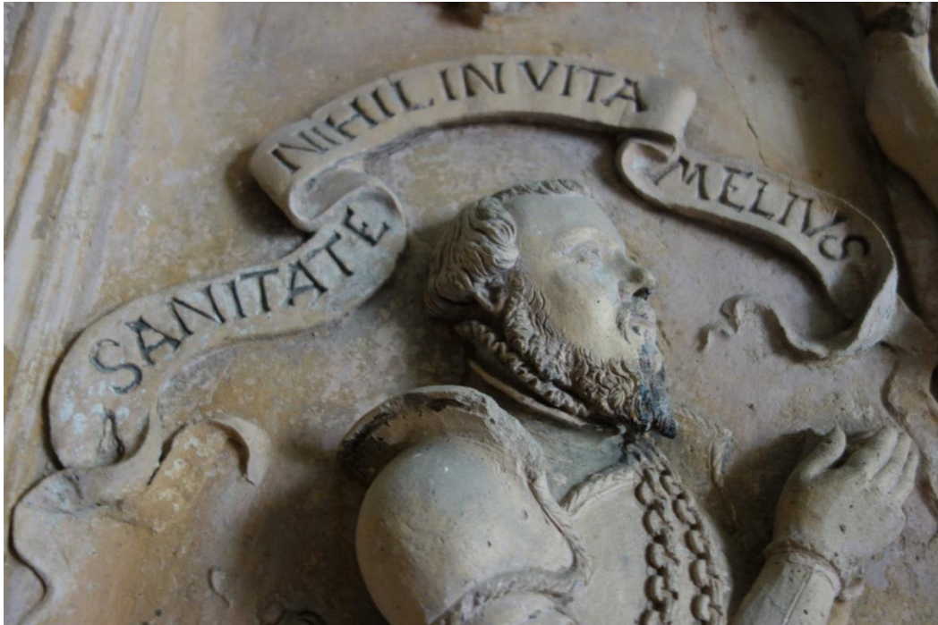
Abb. 10: Mittlere Inschrift, Wahlspruch.

Mittlere Inschrift (s. Abb. 10): der Wahlspruch auf dem bewegten Band ist in derselben Schriftgröße (19 mm hoch) ausgeführt wie sie im AMEN am Ende der unteren Inschrift erscheint. Dies heißt, daß der Skulpteur des Epitaphs neben einem Satz von etwas größeren Formstempeln für die drei anderen Inschriften über einen zweiten Satz kleinerer Formstempel verfügt haben muß; die synthetisierende Herstellungstechnik (Zusammenstempeln) der Buchstabenformen ist dieselbe.