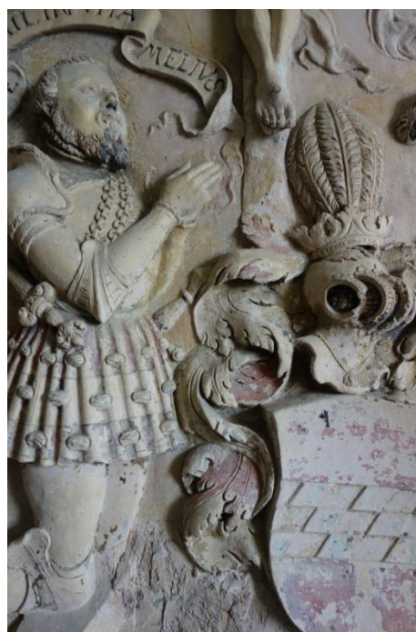
Abb. 2: Akanthusranken zwischen Ritterrock und Schild.

Das Epitaph besteht wahrscheinlich aus sieben größeren Einzelteilen: zwei Basispilaster und die Mittelbasis mit Inschrift, zwei Seitenpilaster mit jeweils drei Ahnenwappen, der Zentralteil mit seinem skulpturalen Bildprogramm und dem Deckgesims. Weiter sieht es so aus, daß die insgesamt 8 Wappen auf den Pilastern separat geformt und gebrannt wurden und erst danach auf den fertig gebrannten Pilastern mit Mörtel befestigt wurden (abzulesen an den Spuren des nicht mehr vorhandenen Wappens des linken Basispilasters; dieser Zustand zeigt sich übrigens schon auf der Abbildung bei Mader (1910: Abb. 40, S. 65)). Andererseits sieht es so aus, als ob das skulpturale Programm des Zentralteils im feuchten Zustand des Tons als Hochrelief herausmodelliert worden sei (dies gilt auch für die Abbeviatur INRI); die Inschriften bzw. die Buchstabenformen wurden als Tiefreliefs herausgearbeitet (s.u. Abschn. 4).