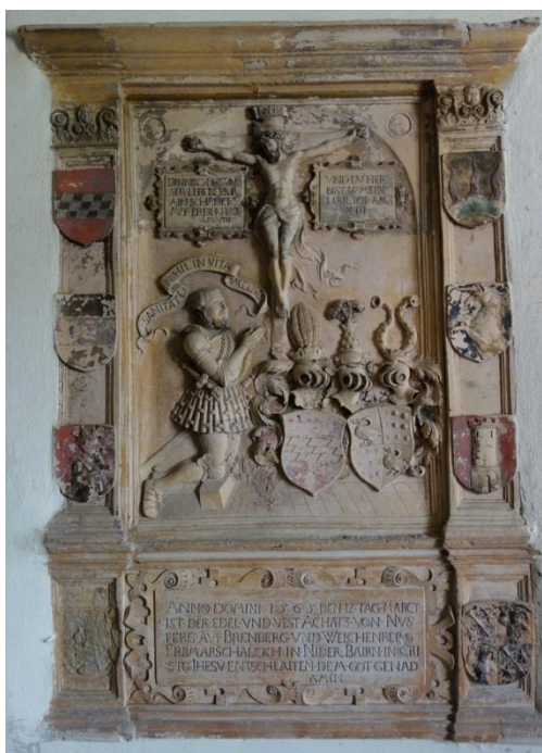
Abb. 1: Gesamtansicht des Epitaphs.

Das Epitaph (Gesamtmaße 1,60 m hoch, 1,15 m breit) befindet sich links vom Kircheneingang hinter einer Gittertür rechts an der Wand des Kreuzgangs. (Abb. 1). Als Material gibt Mader (1910: 65) an: „Solnhofer Stein“; der aufmerksame Betrachter erkennt jedoch an der Ausführung der Inschriften (s. u. Abschn. 4), an der Stuckausführung der Akanthusranken links und rechts der beiden Wappenschilde (s. Abb. 2) und an der Oberflächenqualität des gesamten Epitaphs, daß es sich bei dem Material um gebrannten Ton (= Terracotta) handeln muß.