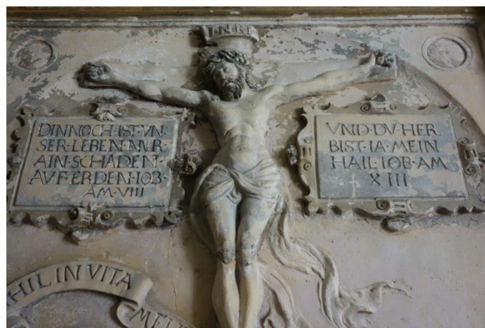
Abb. 5: Kruzifixus mit den beiden oberen Inschriften