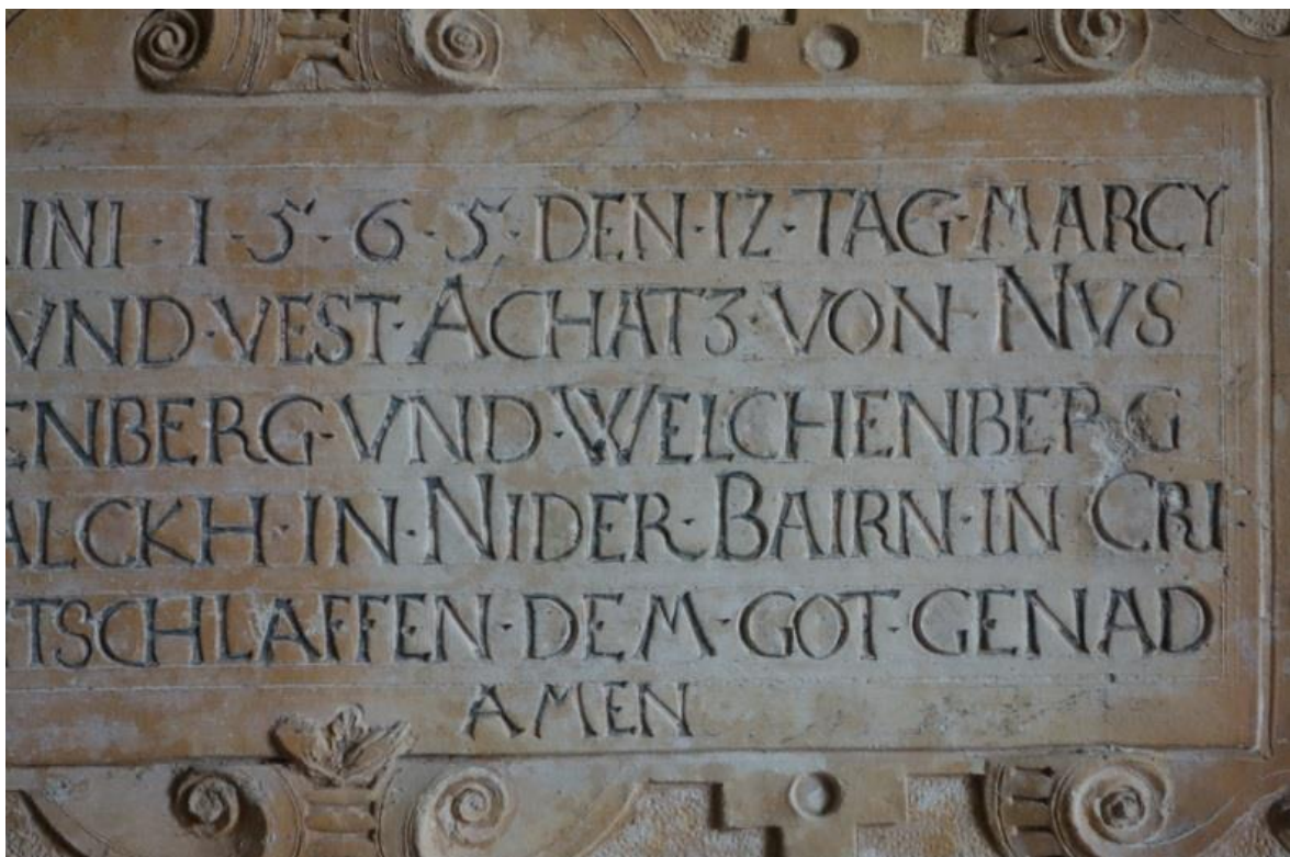
Abb. 9b: Rechter Teil der unteren Inschrift.

Die bisher vorgetragenen Befunde ließen sich durch Detailuntersuchungen an den anderen drei Inschriften weiter erhärten; qualitativ würde sich an den Ergebnissen nichts ändern.