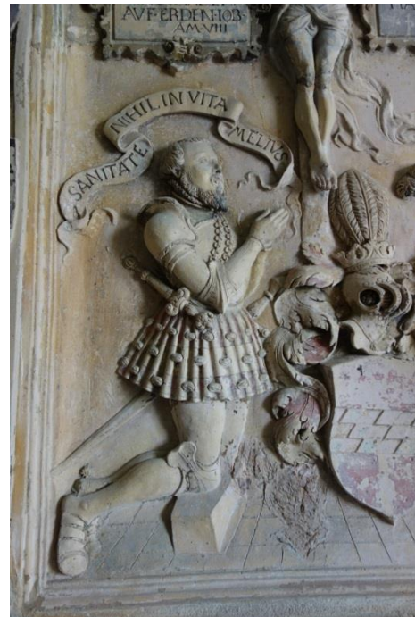
Abb. 4: Achatz von Nußberg mit Wahlspruch.