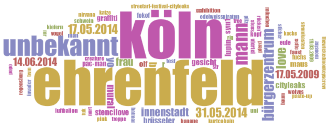
Abbildung 4: Wordcloud der vergebenen Hashtags. Die 5 häufigsten Tags sind dabei ehrenfeld (66), köln (66), unbekannt (19), mann (11) und bürgerzentrum (10).

Von den 475 Bildern wurden in den letzten 7 Monaten 35 von Nutzern als „nicht mehr vorhanden“ gemeldet. Alle Bilder zusammen wurden insgesamt 23.330 mal betrachtet. Außerdem wurden insgesamt 892 Tags (522 unique tags ) vergeben, deren Hauptfunktion die Beschreibung des Orts (Köln, Ehrenfeld, Jugendzentrum, etc.), des Datums , des Künstlers (stencilove, riq, unbekannt, etc.), der Streetart-Kategorie (paste-ups, graffiti, etc.) oder aber des Inhalts bzw. des Motivs (Katze, Banane, Kurt Cobain, etc.) ist (vgl. Abb. 4).