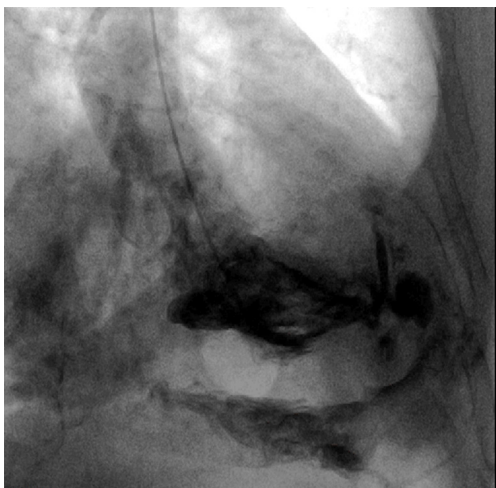
Figure 1 Left ventricular perforation during ventriculography, contrast agent enhancement in pericardial space.

little information exists on their associated complications.