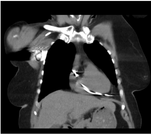
Figure 2 Right ventricular perforation by pacemaker lead to left lateral side. CT imaging without contrast agent.