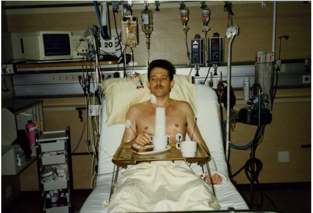
Bild: Ein Tag nach der Herztransplantation.

Die Operation verlief ohne Komplikationen und nach drei Tagen auf der Intensivstation kam ich schon auf die normale Station.