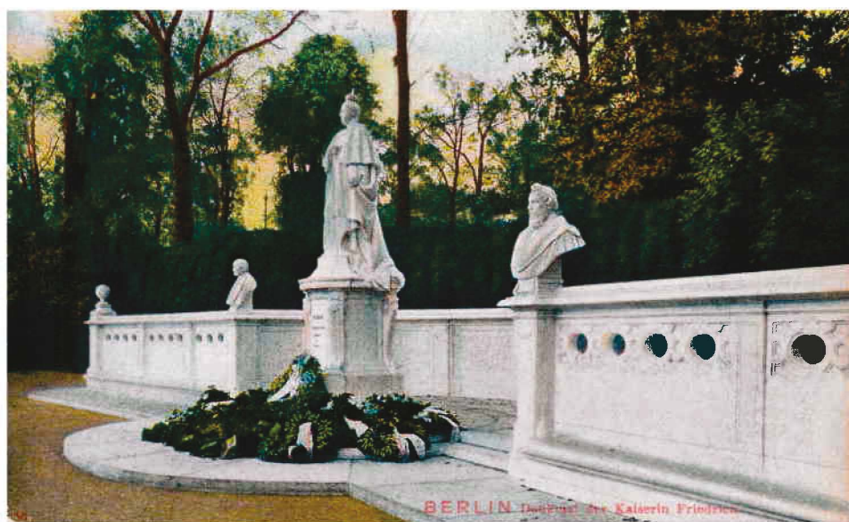
Abb. 1. Gruppe mit Kaiserin Victoria (Kaiserin-Friedrich-Denkmal, da sich Victoria nach dem Tod ihres Mannes „Kaiserin Friedrich“ nannte), links flankiert von Eduard Zeller und rechts von August Wilhelm von Hofmann. Postkarte, Kunstanstalt Carl Garte, Leipzig (1904)

In Anwesenheit des Kaisers, der gesamten kaiserlichen Familie und etlicher fürstlicher Gäste war am 18. Oktober 1903 am neugestatteten Platz vor dem Brandenburger Tor eine großzügige Denkmalanlage eingeweiht worden: zu beiden Seiten der Charlottenburger Chaussee, der heutigen Straße des 17. Juni, und von großen Brunnenanlagen flankiert. Gen Norden zu sehen war Kaiser Friedrich III. (1831–1888), daneben die Büsten des Generalfeldmarschalls Graf Leonhard von Blumenthal (1810–1900) und des „Reichskanzlers der Wissenschaften“ Hermann von Helmholtz (1821–1894); gen Süden Friedrichs Gemahlin Victoria (1840–1901), flankiert von den Büsten des Philosophen und Theologen Eduard Zeller (1814–1908) sowie der des Chemikers August Wilhelm von Hofmann (1818–1892). Letztgenannte zeigt den Chemiker im Talar mit dem Orden Pour le Mérite für Wissenschaften und Künste. Diesen hatte