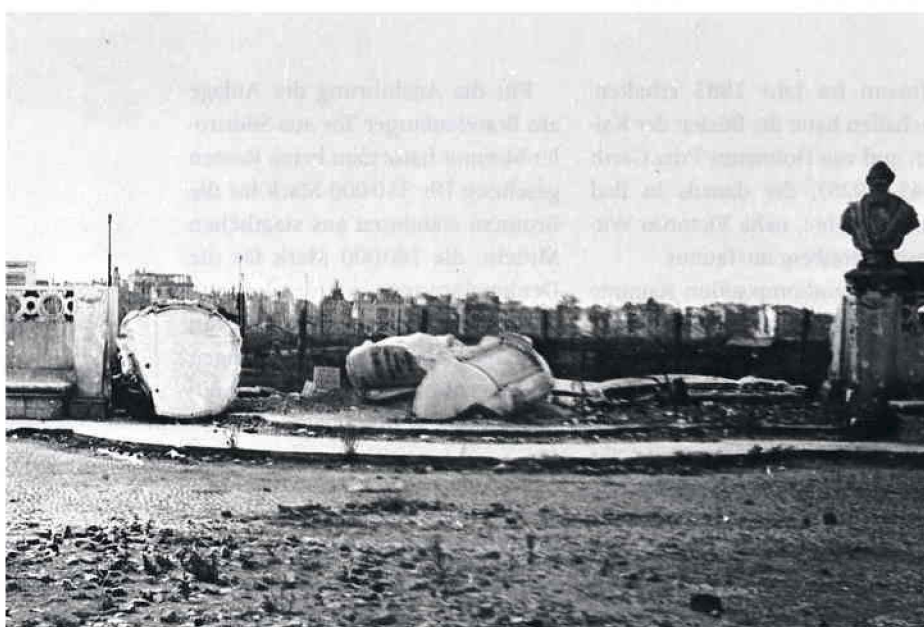
Abb. 3. Die Hofmann-Büste als einziger Überrest des Kaiserin-Friedrich-Denkmal, vom Brandenburger Tor aus gesehen.