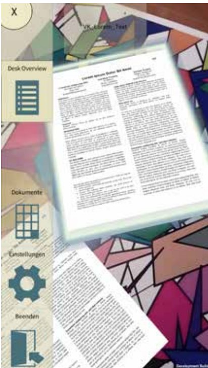
2 Die experimentelle PapAR-Anwendung erlaubt es dem Benutzer, digitale Dokumente auf dem echten Schreibtisch zu platzieren. Diese werden in das Kamerabild des Smartphones eingeblendet.

tem zur Dokumentenorganisation einem rein digitalen und dem Augmented-Reality-System noch überlegen ist, wenn es darum geht, Dokumente schnell wiederzufinden. In einem anderen Projekt untersuchen wir, inwieweit sich digitales Papier besser in traditionelle Arbeitsprozesse einbinden lässt. Ein erster Prototyp ermöglicht es dem Benutzer, beliebige Dokumente über die