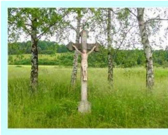
# 1: Die Birken besiedeln als erstes eine Gegend...Neuland?