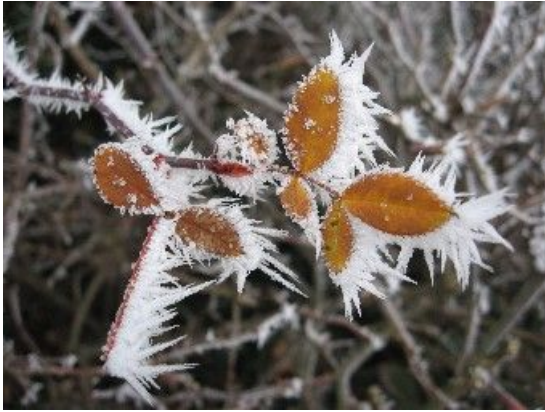
# 3: sehr interessantes Bild zur Betrachtung, Bildtitel: Innehalten