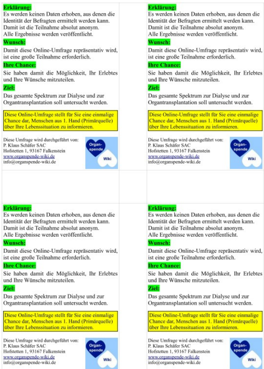
Abb. 4 – Rückseite des DIN-A4-Blattes für den Zuschnitt