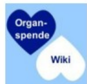
Abb. 2 – Rückseite des DIN-A4-Blattes für den Aushang

Diese Online-Umfrage wird durchgeführt von: P. Klaus Schäfer SAC Hofstetten 1, 93167 Falkenstein www.organspende-wiki.de info@organspende-wiki.de