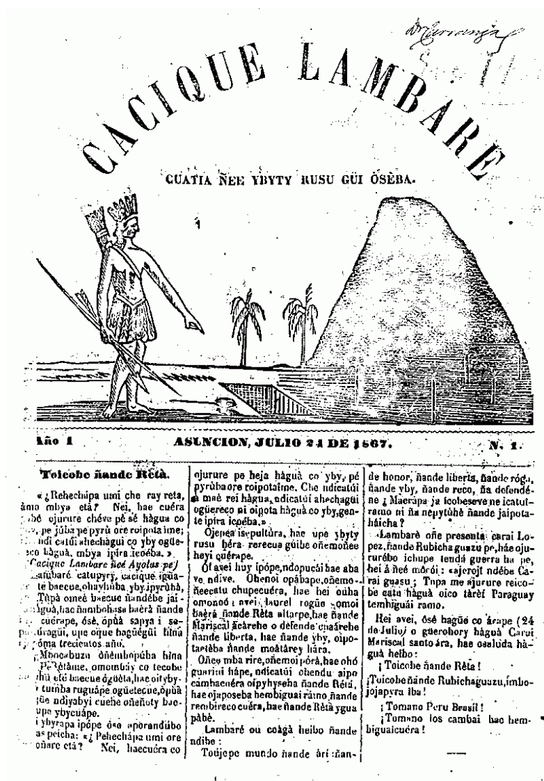
Abbildung 2: Erste Seite des "Cacique Lambaré" vom 24. Juli 1867

http://www.staff.uni-mainz.de/lustig/guarani/cacique/facs/cacique_1.gif (Zugriff am 03.07.2025)